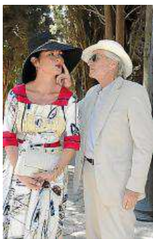
Michael Douglas und Catherine Zeta-Jones im Sommer 2019 auf Mallorca.